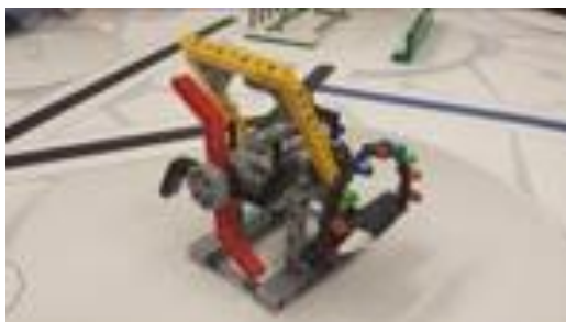
Oude situatie, '4 armen'

Er is vanuit FIRST een wijziging doorgevoerd in de bouwstructie van één van de missiemodellen. Het gaat om het model van de missie 'betrokkenheid'. Er zijn twee 'armen' van het rad waaraan de robot kan draaien verwijderd. Ondertussen zijn de bouwstructies op internet aangepast, maar voor teams die de set al in elkaar hebben zitten is het belangrijk dat zij dit model aanpassen. Op alle regiofinales zal het model namelijk 2 armen hebben i.p.v. de oorspronkelijke 4 armen. Ter verduidelijking heb ik hieronder afbeeldingen van de oude en nieuwe situatie gezet.