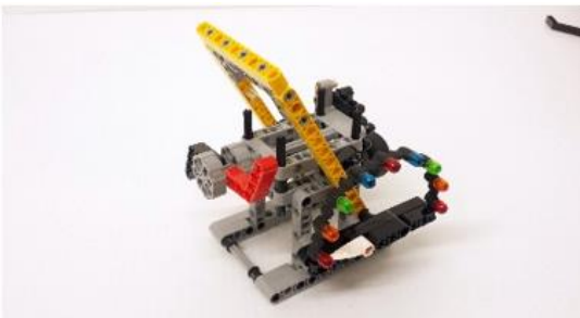
Nieuwe situatie, '2 armen'